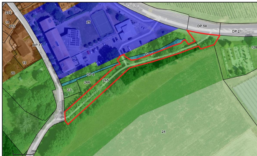
Figure 2: Affectations selon le PGA de 1979. En rouge: périmètre du transfert au DP.

Cette route se trouve sur les parcelles n° 128 et 265 propriétés de la commune et dans une moindre mesure sur la parcelle n° 25. Selon l'ancien plan d'affectation approuvé le 10 janvier 1979, ces parcelles étaient affectées en zone de verdure (voir Figure 2).